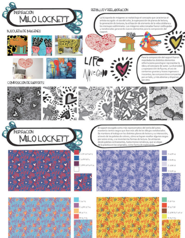
Figura 1: Referente Milo Lockett, redibujo y diseño motivo y rapport.