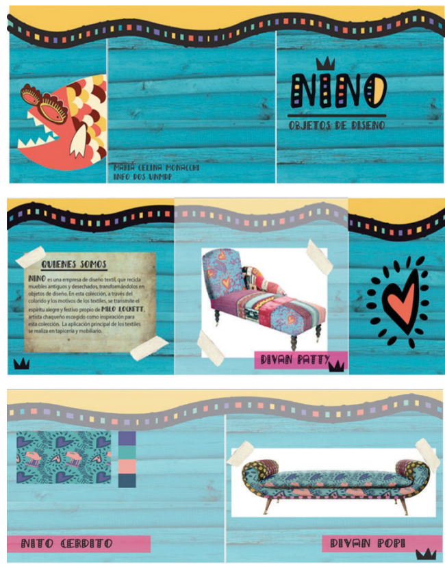
Figura 4: Portada desplegada catálogo y páginas interiores.