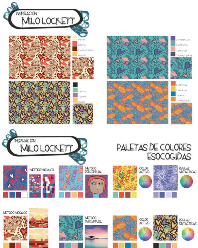
Figura 2: Diseño rapports alternativos y paletas color.