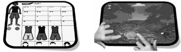
Figura 2. Personificación de la familia / Figura 3. Búsqueda de pianguas