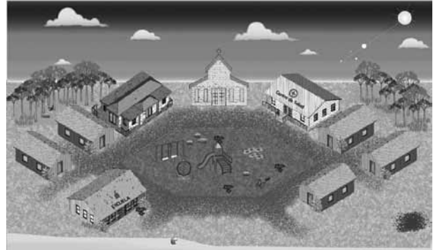
Figura 4. Pueblo en máximo bienestar

ca y económica de la familia y del tiempo seleccionado (conocido en el juego como nivel de esfuerzo).