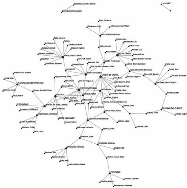
Figura 2. Diagrama de redes creado en Many Eyes

Con el primer diagrama se concluyó que un porcentaje importante de personajes a los que el autor se refiere tienen relativa relevancia dentro del tema que se va a tratar. Con el segundo diagrama se identificaron los mayores representantes de la arquitectura moderna, según el autor y, aún más resaltante, cómo se interrelacionan, influyen y agrupan entre sí.