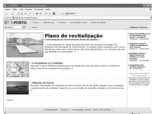
Figura 1. Homepage TVPORTO

Para representar esse objeto de conhecimento, foi realizada uma decoupage que resultou no reconhecimento da espacialidade do lugar, nos projetos de transformação propostos pelo Estado e pela comunidade, e na produção de um sistema de informação sobre os processos em curso.