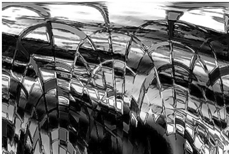
Figura 2. Juncos