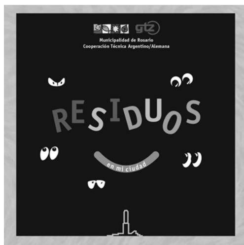
Figura 1. CD los residuos en mi ciudad.

que se traducen en los procesos que se buscan promover: conductas proactivas de minimizar, reutilizar, reciclar, etc.