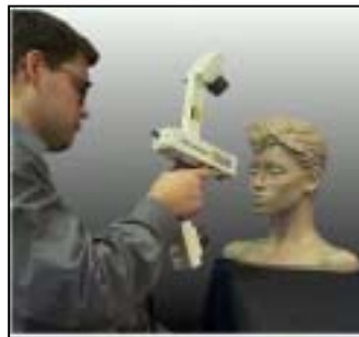
Abb. 6: Handgeführter Laser-Scanner HLS /HLS, 2003/

Aber genau dort kann die hohe Visualisierungsqualität des scannenden Verfahrens optimal eingesetzt werden, um die Modellierung von kritischen Punkte am Bauwerk vornehmen zu können. Denkbar sind Anwendungen zur Modellierung von Knotenpunkte in Dachstühlen oder die vor Ort Modellierung von Kapitellen, Skulpturen etc.