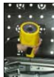
Abb.5: ProCam Messtaster on-site

In den Messtaster sind drei CCD-Kameras integriert, die ein Bezugsfeld aus codierten Messmarken beobachten, daraus wird die Position des Tasters berechnet. Für die Detailerfassung in Gebäuden kann die interne Referenz durch sogenannte Target-Panel realisiert werden, die frei im Raum positioniert werden können. Die Antastspitzen sind frei zu