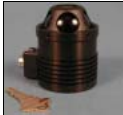
Abb.2: HiBall-3100 optical sensor