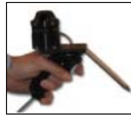
Abb.3: HiBall-3100 Stylus

Das System besteht aus einem optischen Sensor mit sechs angeordneten Linsen, sodass eine Rundumsicht gewährleistet werden kann (Abb.2). Beobachtet werden Infrarot LED's die als Referenzmarken im Arbeitsbereich angebracht werden. Die Montage mit einem Stylus verwandelt den HiBall-Sensor in einen taktilen Taster zur Positionierung (Abb.3). Das HiBall-3100 System ist für Laborbedingungen ausgelegt, eine Anpassung für den Baubereich muss sich aus dem Praxiseinsatz ergeben.