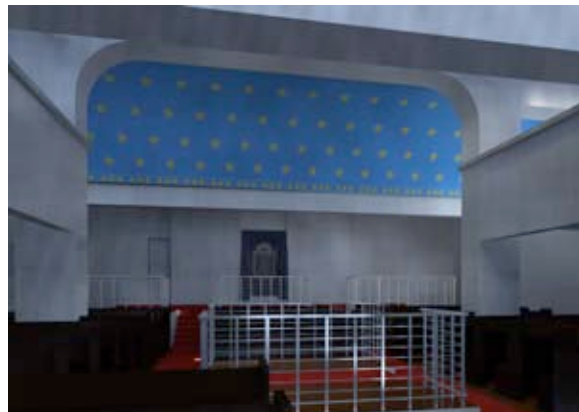
Abb. 11b Erweiterung der Lichtsimulation um die Verwendung von Farbglass in den Oberlichtern.