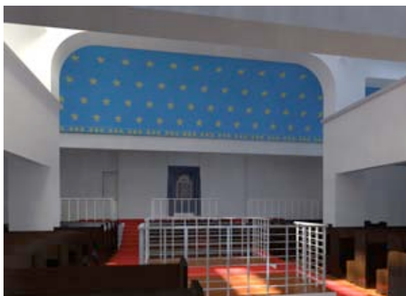
Abb. 12a Lichtsituation: 21. Juni – 12.00 Uhr.