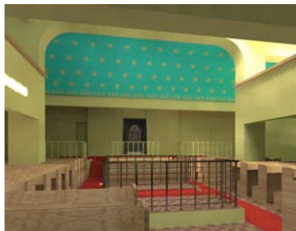
Abb. 9 Mangelhafter Umgang mit Texturierungen und Materialdarstellungen.