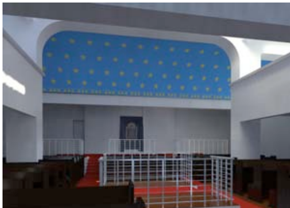
Abb. 11a Annäherung an eine Raumsimulation über Materialfestlegungen und Tageslicht (Weißglas).