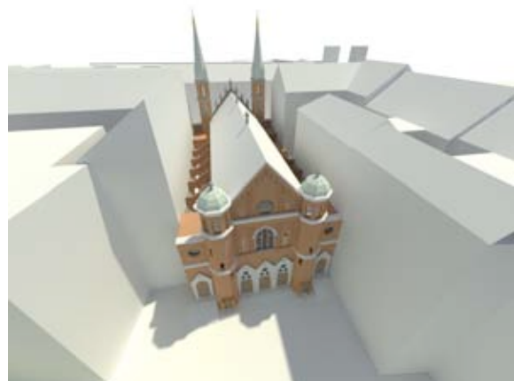
Abb. 2 Grundstück und Synagoge: Typische Lage im einer geschlossenen Straßenfront (hofseitige Ansicht – Müllnergasse 21 - Wien).

Es wird nicht ausschließlich das Gebäude auf seinem Grundstück modelliert, sondern weiterführend auch die angrenzenden Bauten. Im generierten (abstrahierten) Umgebungsmodell wird somit der Kontext nachgestellt.