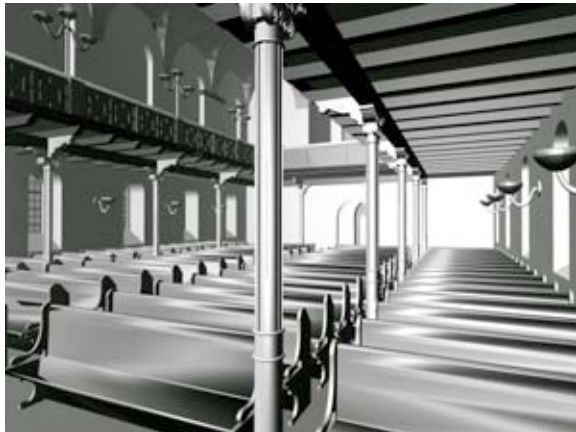
Abb. 10a Innenraumsimulation im Jahr 2001 (Turnergasse 22).

Während im Jahre 2001 noch die Summe der Einzellichtquellen – Sonne (paralleles Licht), Leuchten (kugelförmiges Licht), sowie Spots (zielgerichtetes Licht) das Modell ausleuchten, reicht bei aktuellen Simulationsversuchen lediglich die Sonneneinwirkung in Kombination mit einer globalen Hintergrundbeleuchtung aus, um den Raum im identischen Computermodell wesentlich realistischer auszuleuchten (Abb. 10-14).