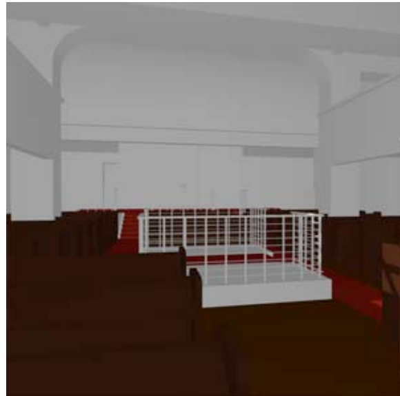
Abb. 3 Innenraumdarstellung mittels der internen Render-engine (ArchiCAD).

Grundsätzlich muss dazu festgehalten werden, dass Softwarepakete mit einem vergleichbaren Leistungsangebot (Lightworks-Render, Cinema4D, MaxwellRender, 3D Studio VIZ, etc.) hinsichtlich der Bedienbarkeit einen deutlich höheren Lernaufwand verursachen. Es sind demnach nutzerseitige Anstrengungen vorzuweisen, um die Komplexitätsfrage in den Griff zu bekommen.