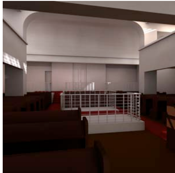
Abb. 7 Cinema 4D: Ergebnis einer Tageslichtsimulation über „global illumination“.

Die sich ergebende Berechnungszeit ist in Abhängigkeit von der Anzahl der Lichtstrahlen und ihrem Auftreffen auf einer Materialoberfläche (Reflexionseigenschaften) zu sehen. Speziell bei transparenten Materialien kommt die Anzahl der sog. refractions (Lichtbeugung; Reflexion in Glas) zum Tragen. Bei der Berechnung des Lichtmodells ist naturgemäß auch der Sonnenstand, die geografische Lage, wie auch die jeweilige Tages- und Jahreszeit zu berücksichtigen. Eine Grundbeleuchtung im Hintergrund wird über die sog. „global illumination“ erzeugt, welche den berechneten Darstellungen letztlich eine deutliche Steigerung der Realitätsnähe verleiht.