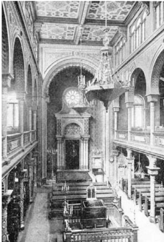
Abb. 14a Historische Schwarz-Weiß-Abbildung in aufgehelltem Darstellungsmodus.