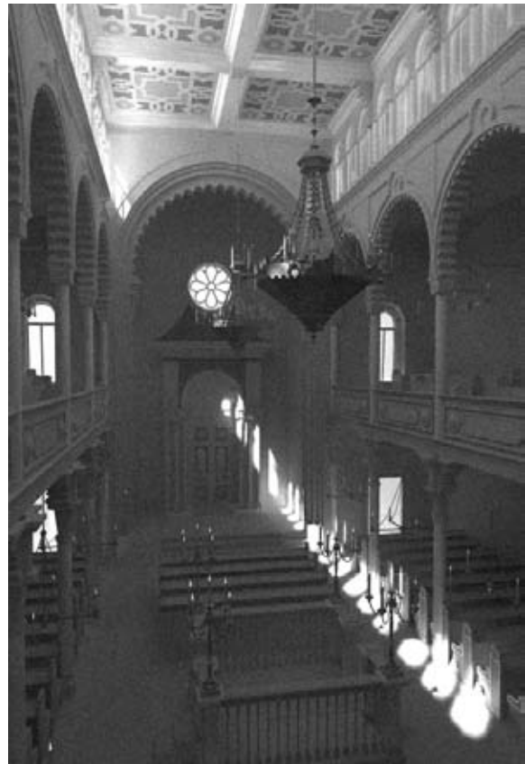
Abb. 14b Simulierte Schwarz-Weiß-Visualisierung zur vergleichweisen Überprüfung des tatsächlichen Tageslichteinfalls.