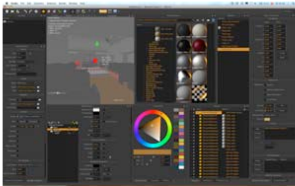
Abb. 6 Maxwell Render Studio: Interface mit vielen Optionen in Bezug auf Licht- und Materialeigenschaften.

Die Erprobung von alternativen Belegungen spielt eine wesentliche Rolle und kann sinnvollerweise via Teilrenderings vorab überprüft werden. Je nach verwendeter Software-Applikation bietet diese im Vorfeld eine Preview-Funktionalität, welche die Bearbeitungsdauer unabhängig vom anschließenden Berechnungszeitraum deutlich reduziert und etwaige Redundanzen aufzeigt. Für die Berechnung selbst sind in weiterer Folge auch die Berechnungsmethoden ( flat-shading , ray-tracing oder radiosity ) zu berücksichtigen.