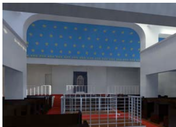
Abb. 12b Lichtsituation: 21. Dezember – 12.00 Uhr.