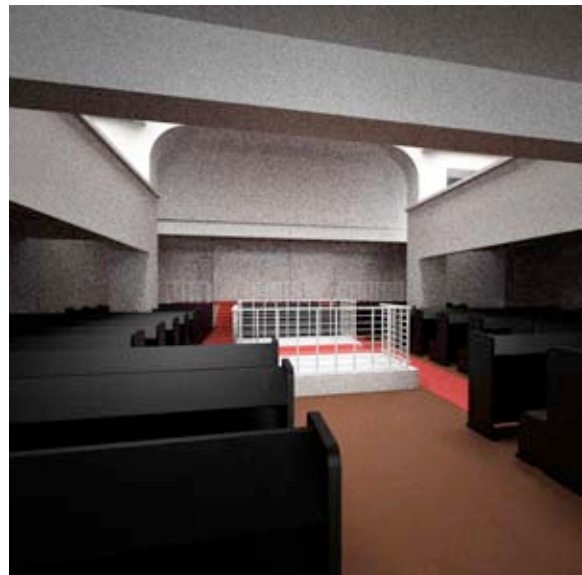
Abb. 8 Maxwell Render 2: Status einer „weichen“ Darstellung.