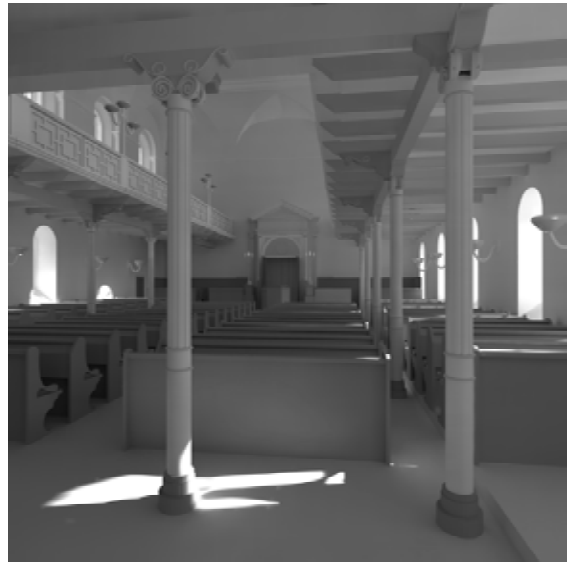
Abb. 10b „State of the Art“ Darstellung anno 2010.

Die realitätsnahe Wiedergabe von globaler Hintergrundbeleuchtung im Zusammenspiel mit simulierter Sonneneinwirkung erlaubt eine realistische Studie jahreszeitlicher Lichtwechsel und deren Auswirkung auf den Innenraum.