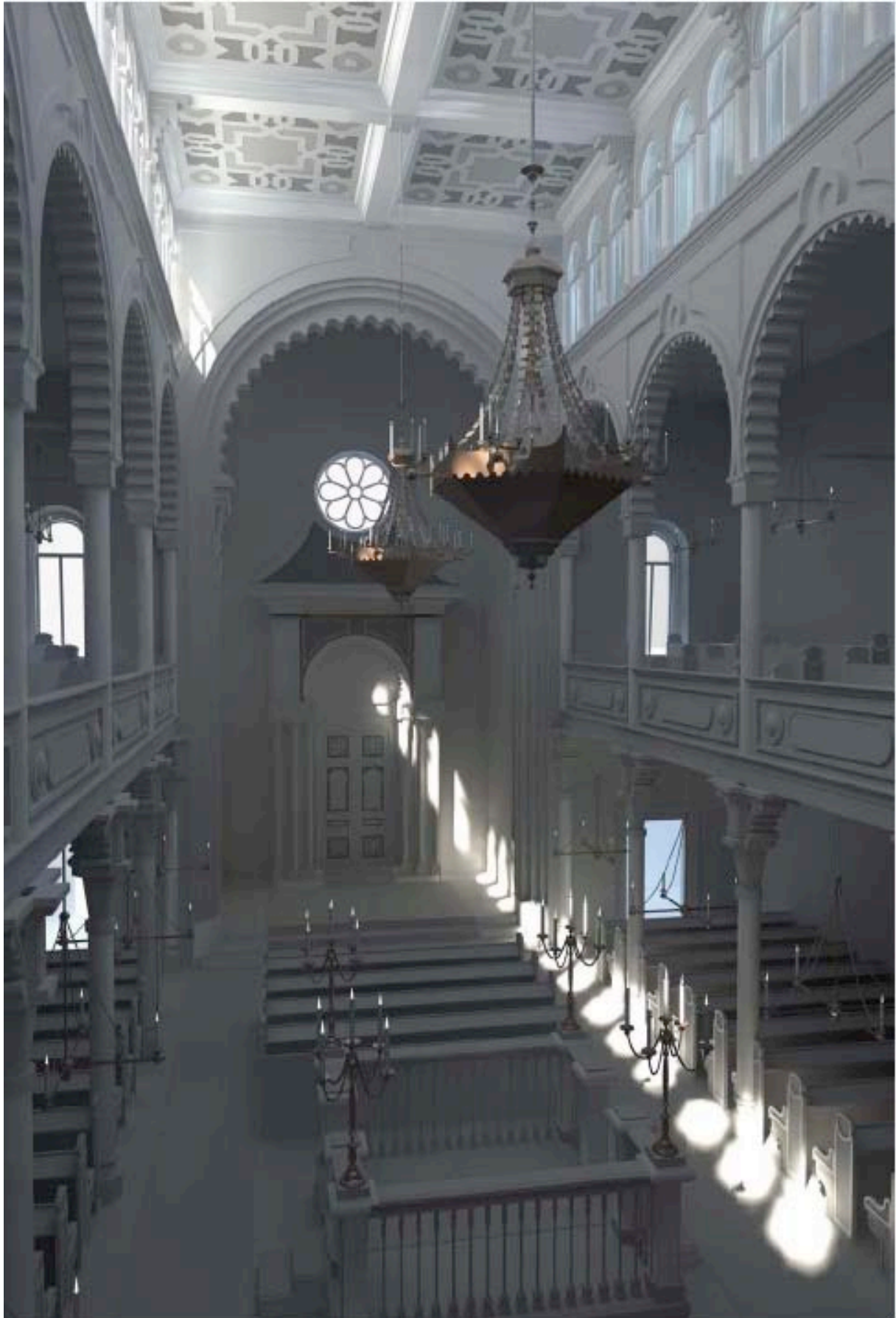
Abb. 13 Simulation der „Polnischen Schul“ in realitätsnaher Darstellung (maximale Tageslichtanteile).