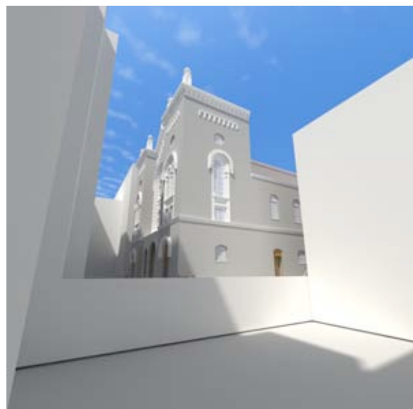
Abb. 1 Synagoge und städtebauliches Umfeld: Lage und Orientierung als wichtige Parameter („Hinterhof“-Synagoge Schopenhauerstrasse, Wien).

Nachdem die Durchführung der laufenden Rekonstruktionsarbeit einen längeren Zeitraum in Anspruch nahm, konnte auch eine signifikante Entwicklung im Bereich der eingesetzten Softwarepakete geortet werden, welche sich vordergründig der getreuen Darstellung von Lichtverhältnissen widmet. Dies ist insofern von Bedeutung, als das von so manchen Synagogen im Normalfall nur das eine oder andere Außenraumbild überliefert wurde. Des Öfteren ist nicht eine einzige Innenraumaufnahme vorhanden. Es handelt sich überdies vorwiegend um Schwarz-Weiß-Aufnahmen, da die Farbfotografie in der ersten Hälfte des 20. Jahrhunderts noch weitgehend in den Kinderschuhen steckte.